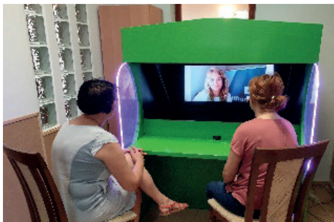
VIVIEN Telepresence Kioszk